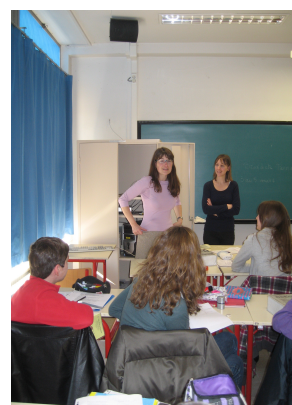
Educafrances parmi nous, en salle D 26

Elle a été créée en 1835 sous le nom d'Agence Havas par Charles-Louis Havas. Pendant l'occupation allemande, en 1940, elle fut nommée "Office Français d'Information" et servait la propagande nazie. A la Libération, un groupe de journalistes résistants s'empara de l'agence et la rebaptisa Agence France Presse.