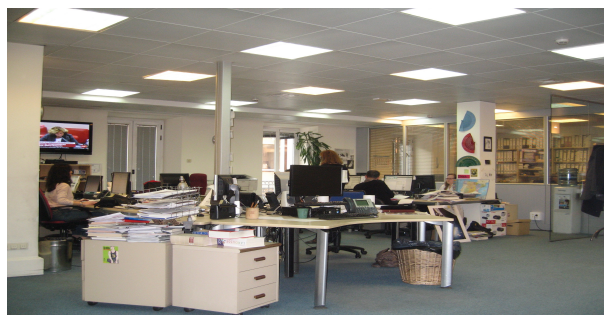
Les locaux de l'AFP à Madrid : au coeur de l'information

Nous repartons ravies vers le Lycée, prêtes à rédiger la fin de notre reportage en herbe!