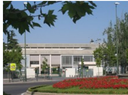
Lycée Français de Madrid

Adresse du site Internet de l'établissement : http://www.lfmadrid.net