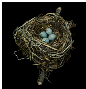
Swainson's Thrush Catharus ustulatus, Musée de zoologie, 1925, ©Sharon Beals

États-Unis pour capturer ces oeuvres d'art à l'état naturel, Sharon Beals, infatigable, parcourt musées, universités et collections privées, animée d'une insatiable curiosité. Et c'est ce virus de curiosité qu'elle cherche à transmettre au public en prenant ses photos avec une âme de naturaliste.