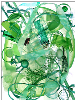
Not so Green

Le résultat ressemble à un collage fait d'éléments hétérogènes inexplicablement liés les uns aux autres. C'est le cas de l'image Pas si vert , intitulée avec une bonne dose d'ironie : certes, la couleur du plastique est bien verte, mais c'est un vert hypocrite, presque trop saturé, une médiocre imitation du vert de la nature.