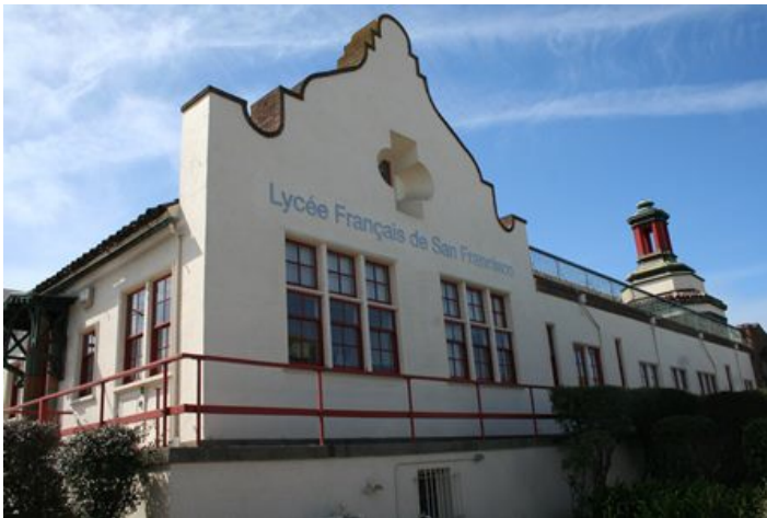
Le Lycée, 1201 Ortega Street