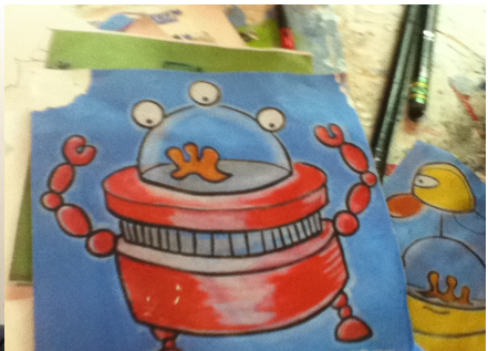
Scrapbats et Duckboy Deux figures phares de l'univers de Johnny Botts.