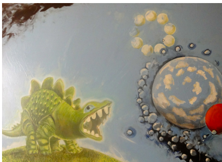
Le stégosaure Une des premières peintures de l'artiste ©LFSF 2013