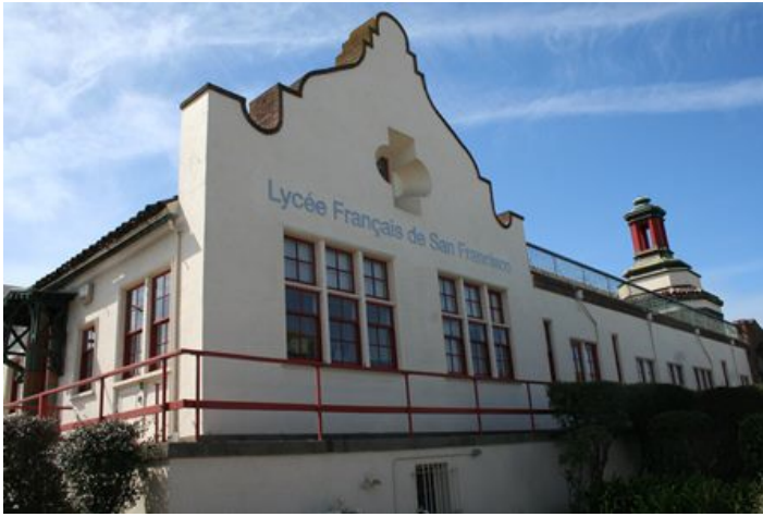
Le Lycée, 1201 Ortega Street