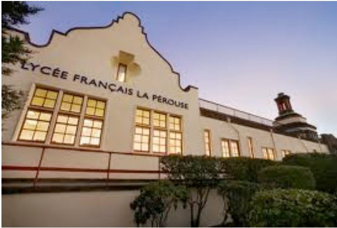
Le Lycée, 1201 Ortega Street © Lycée la Pérouse