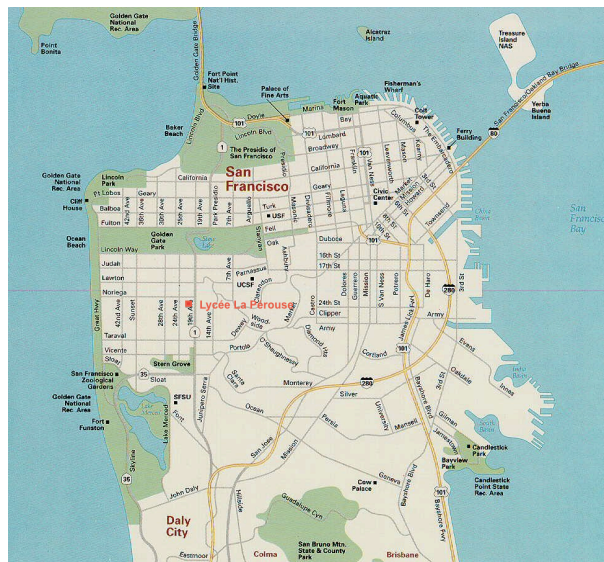
Carte de San Francisco © USA City Maps