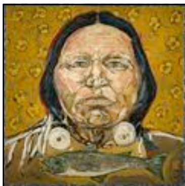
Indian Portrait en fleur avec poisson, 2006

Ainsi, une de ses plus célèbres séries de tableaux représente des indiens majestueux aux regards troublants. « Ils ont vécu là... et on les en a enlevés. Ils étaient très pauvres. Ils ont tout perdu. Ce sont de gens intéressants. » explique-t-il. Alors ces tableaux, c'est une manière de leur rendre hommage, de leur restituer tout cet honneur et cette fierté qu'on leur a retirés. Toujours ce souci de l'autre qui transparaît dans ses toiles.